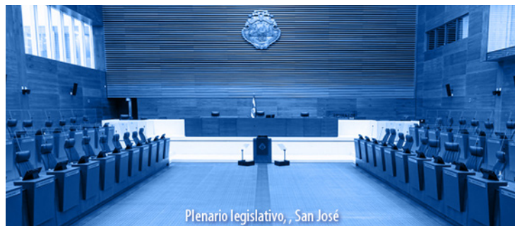
Plenario legislativo, San José

Los Alcances N° 118 y N° 119, a La Gaceta N° 110; Año CXLIV, se publicaron el martes 14 de junio del 2022.